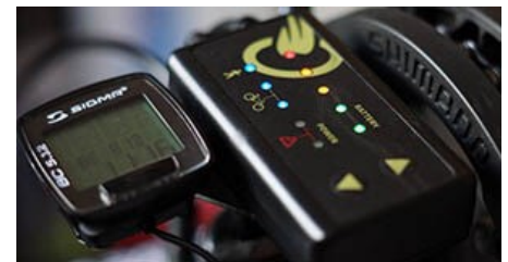
Ένδειξη μπαταρίας, ρύθμιση ταχύτητας, LCD οθόνη.