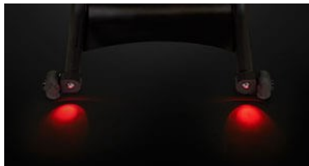
LED φωτισμός πίσω.