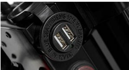
2πλος φορτιστής USB.