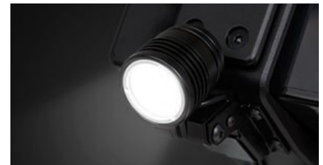
LED φωτισμός 900 lumens μπροστά.