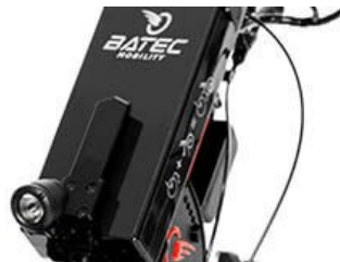
Μπαταρία Ιόντων λιθίου.