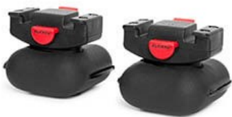
Βαρίδια για καλύτερη πρόσφυση στο έδαφος.