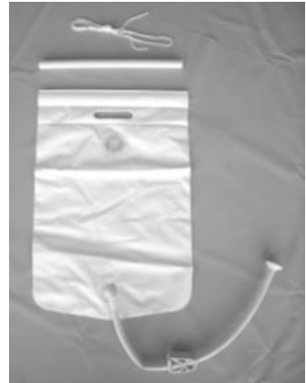
Water bag, optional