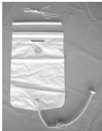
Σάκος νερού (Προαιρετικός)